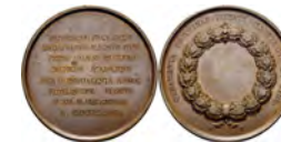
Kupfermünze zum 50-jährigen Amtsjubiläum.

Was wurde aus seinen weitsichtigen Forderungen? Ein Fonds zum Ankauf astronomischer Instrumente wurde eingerichtet, das 1835 errichtete kleine Observatorium konnte der fast erblindete Hecker nicht mehr nutzen. Die Vereinigung der akademischen Kassen erfolgte 1834 durch den Vizekanzler Both. 1853 begann die Neuvermessung Mecklenburgs unter Friedrich Paschen (1804–1873), die erst 1882 abgeschlossen wurde. 1874 wurde Ludwig Matthiessen (KB 11/2011) auf den ersten eigenständigen Lehrstuhl für Physik berufen. Peter Johann Hecker starb am 17. September 1835 in Rostock. Die Professur ging an Hermann Karsten (KB 03/2013).